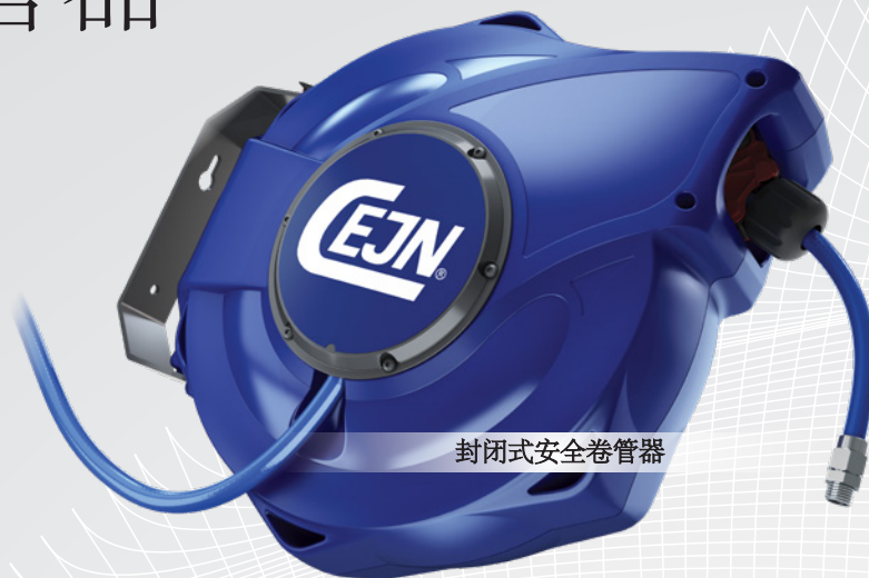
封闭式安全卷管器